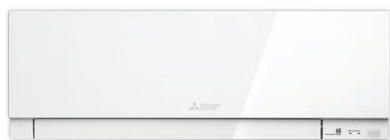
Zen White (бял)