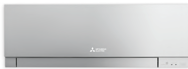
Zen Silver (сребрист)