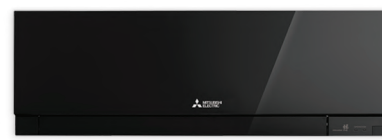
Zen Diamond (черен)